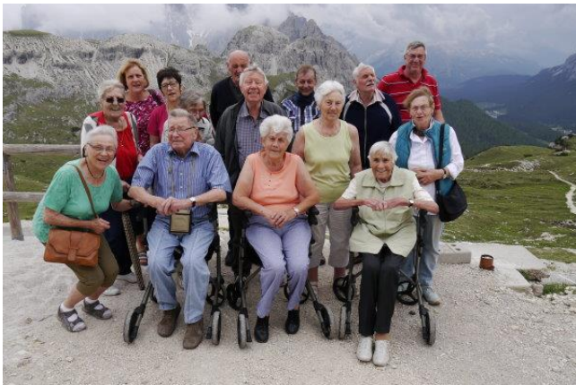
Gruppenfoto mit Bewohner, Gästen und Betreuern während dem Ausflug zu den „Drei Zinnen“