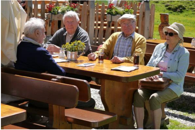
Die einhellige Meinung der Gruppe: Tolle Fahrt!